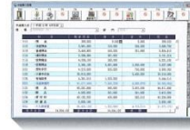
▲中途導入処理画面

期首日から導入日までのデータを科目別・部門別に登録できるので、期中の導入も難なく行えます。