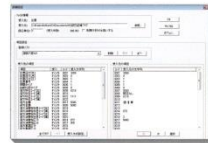
▲データ受け入画面

仕訳データだけでなく、補助科目、科目間首高、部門、部門グループ、予算などのマスターデータをCSV形式で受け入れることができます。受け入れる項目や順番を個別に指定できるので、他ソフトやオフコンからの載せ替えも簡単です。もちろん、項目や順番の設定は登録可能なので何度も設定する必要がありません。