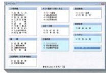
▲メインメニュー画面

「建設大臣」の操作は、カーソルキーで選んで決定キーを押すだけの簡単操作。また、Windowsのプルダウンメニューや数値入力による操作項目をご用意しています。ユーザー様の操作しやすい方法で、全ての項目を操作できます。